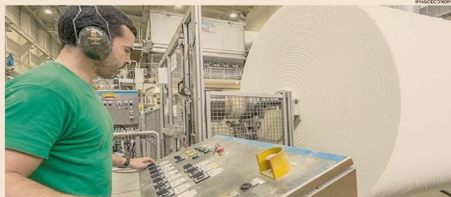
Produzione di carta. Il settore è interessato da incrementi eccezionali del costo dell'energia.